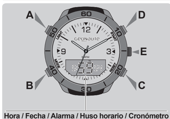
Hora / Fecha / Alarma / Huso horario / Cronómetro